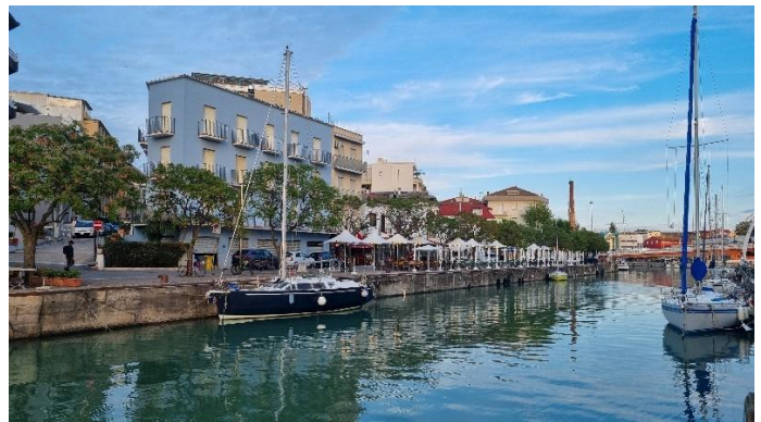
Gabicce Mare/Cattolica