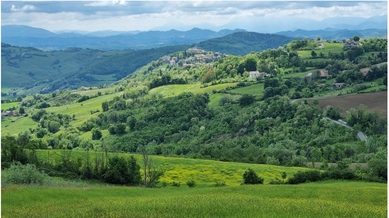
Blick auf den Apennin