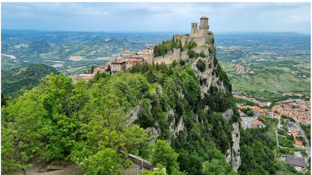
Prima Torre von San Marino

Wir besuchen zusammen San Marino und genießen eine Führung durch die Stadt. San Marino ist ein bergiger Kleinstaat und vermutlich die älteste Republik der Welt. Sie ist für ihre von einer Mauer umgebenen mittelalterlichen Altstadt und die schmalen, kopfsteingepflasterten Strassen bekannt. Auf den benachbarten Gipfeln stehen drei Wehrtürme aus dem 11. Jahrhundert. Unzählige sympathische Restaurants laden zum Geniessen ein. Und auch das Shopping kommt hier nicht zu kurz.