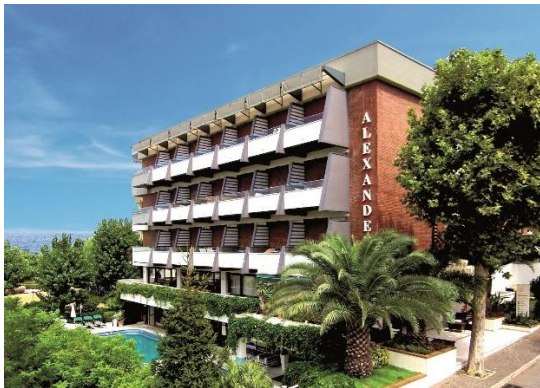
Hotel Alexander in Gabicce Mare