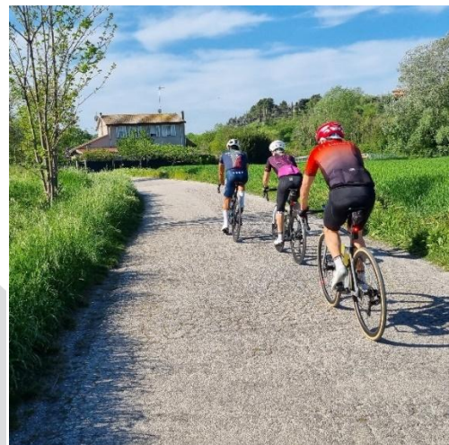
Unterwegs in den Marken