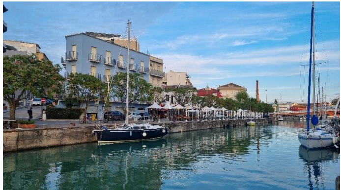
Gabicce Mare/Cattolica