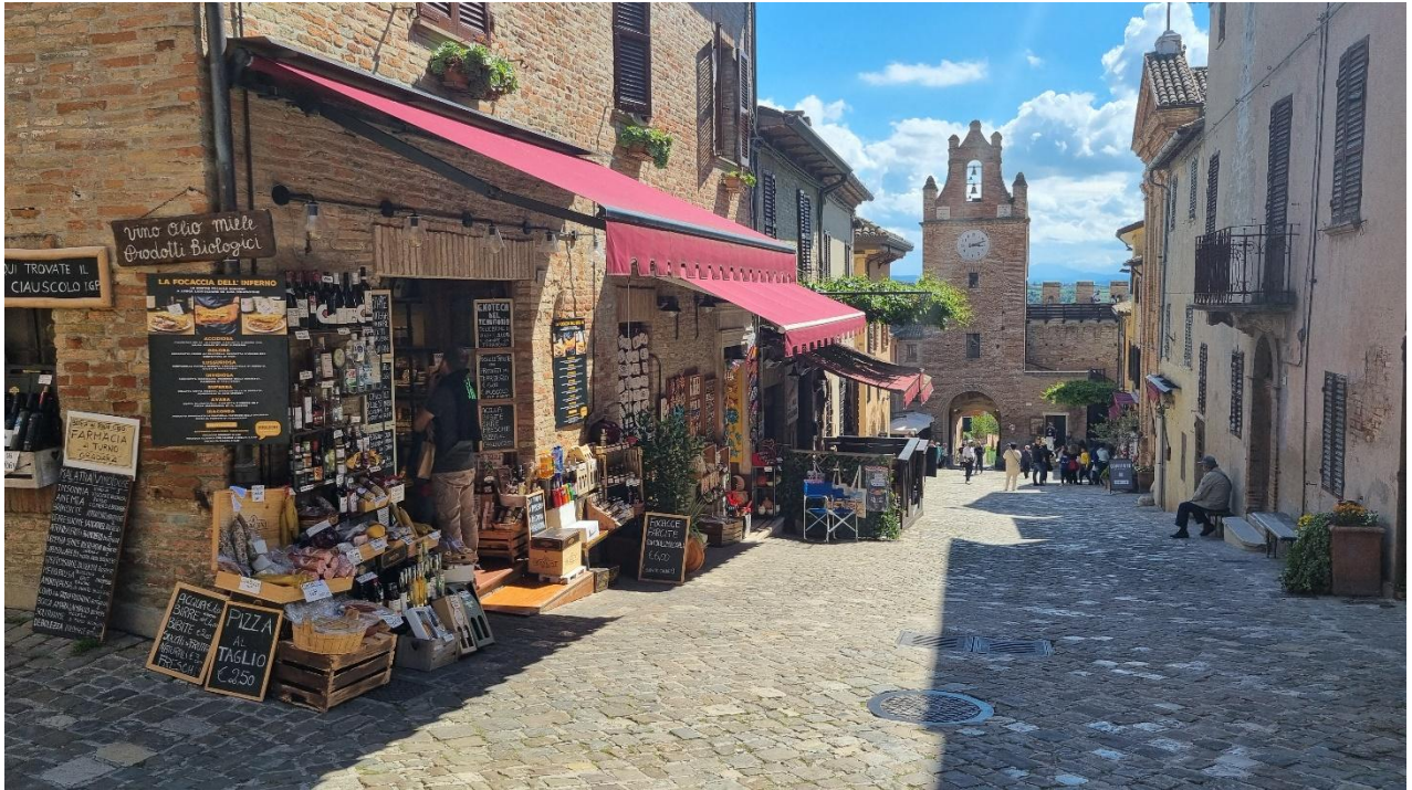
Burg von Gradara