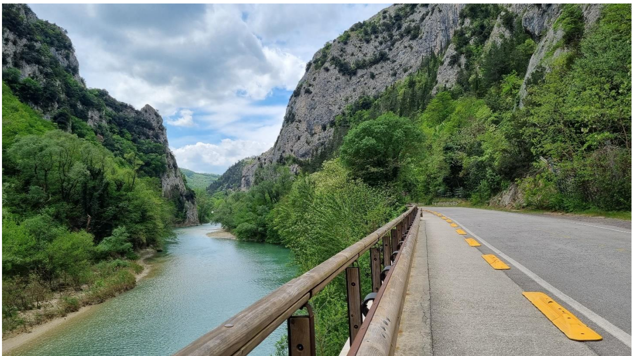
Gola del Furlo

Optional hängen wir hier eine Zusatzschleife durch die Furlo-Schlucht an und befahren die antike Römerstrasse 'Via Flaminia'. Auf einer Höhe von 212 MÜM hat der Fluss Candigliano eine atemberaubende Schlucht gegraben. Um das Reisen zu erleichtern, baute der römische Kaiser im 1. Jahrhundert einen 38 Meter langen und 5 Meter breiten Tunnel. Wenn man bedenkt, dass dieser nur mit Meissel und Hammer geschaffen wurde, ist man wirklich beeindruckt!