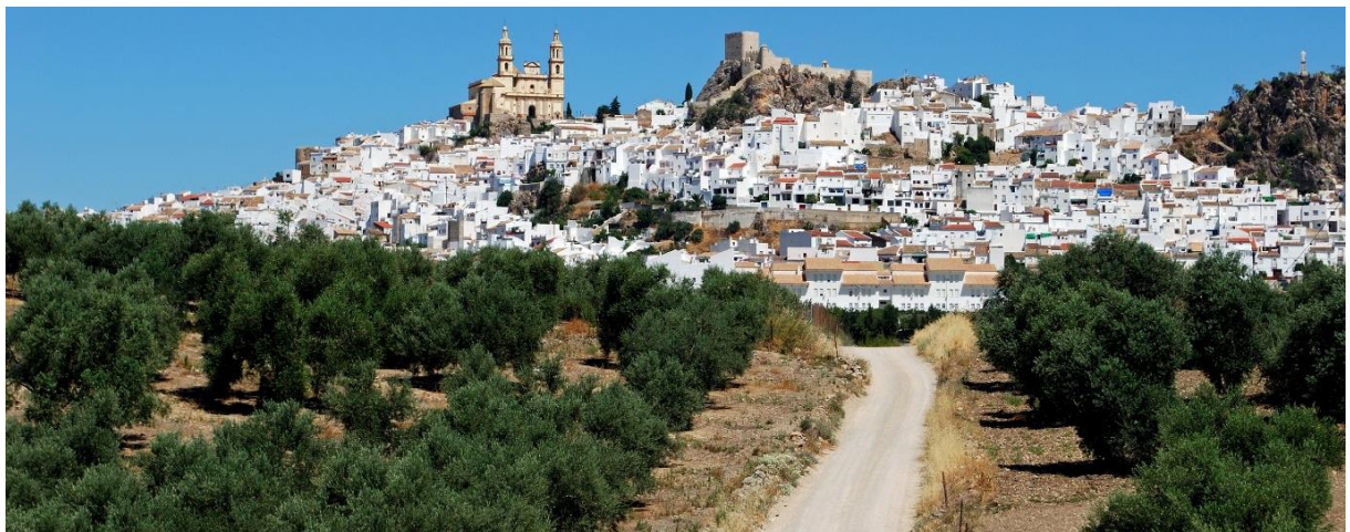
Olvera, Pueblo Blanco (Weisses Dorf) in der Provinz Cadiz