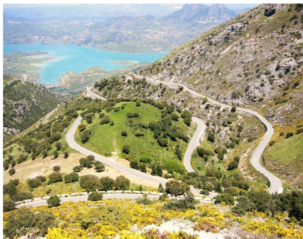
Puerto de las Palomas