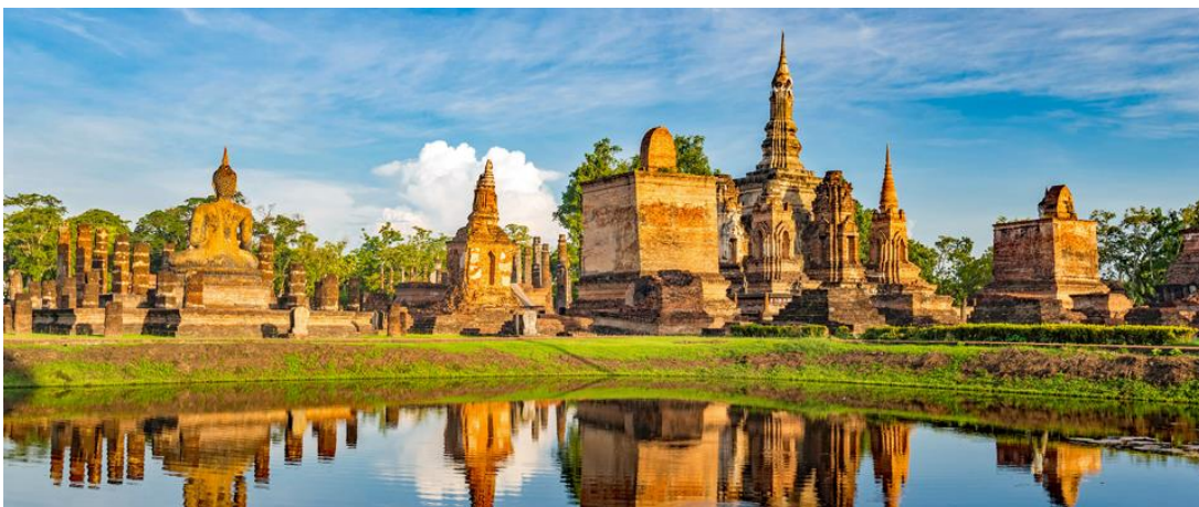
Sukothai Historical Park