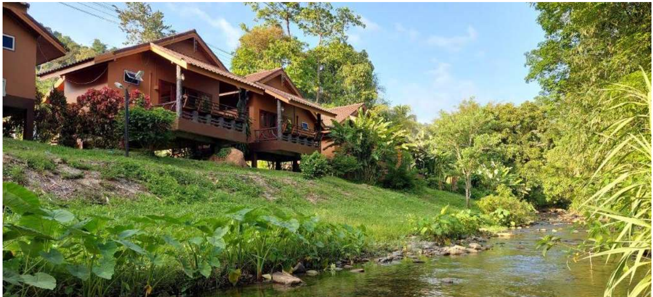
Khao Sok Rainforest Resort