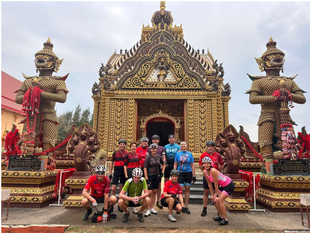
Wat Khao Kalok Tempel Prachuab Khiri Khan